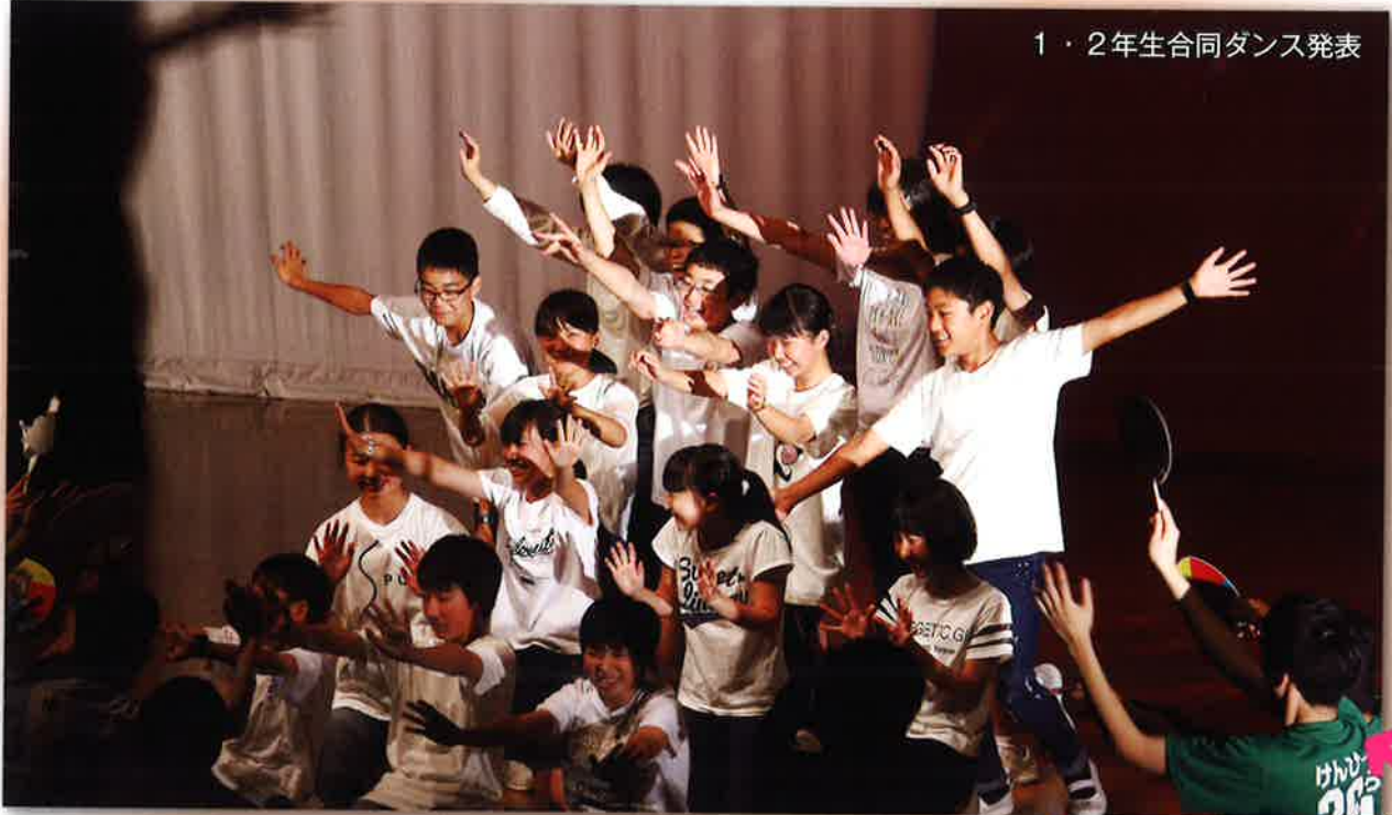
1・2年生合同ダンス発表