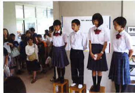
学校紹介プレゼンテーション