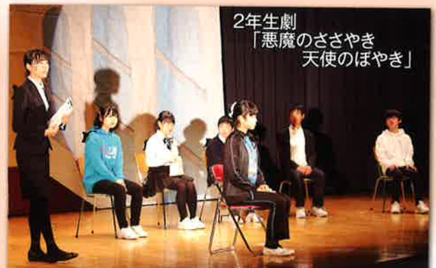
2年生劇「悪魔のささやき 天使のぼやき」