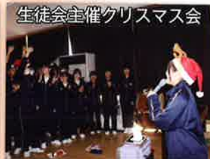
生徒会主催クリスマス会