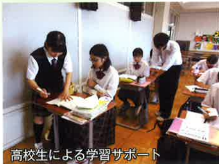
高校生による学習サポート